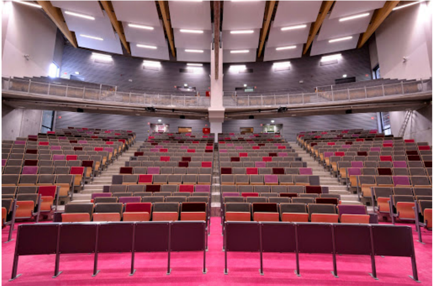
Faculté de médecine, UCL, Bruxelles