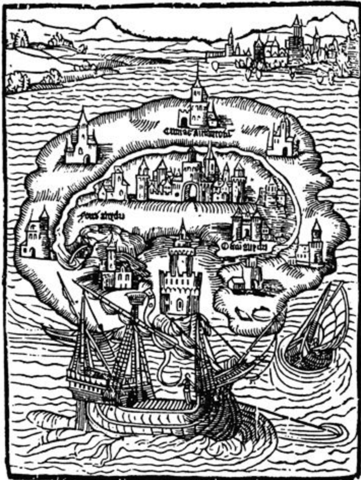
Thomas Morus UTOPIA Édition de 2016 Leuven