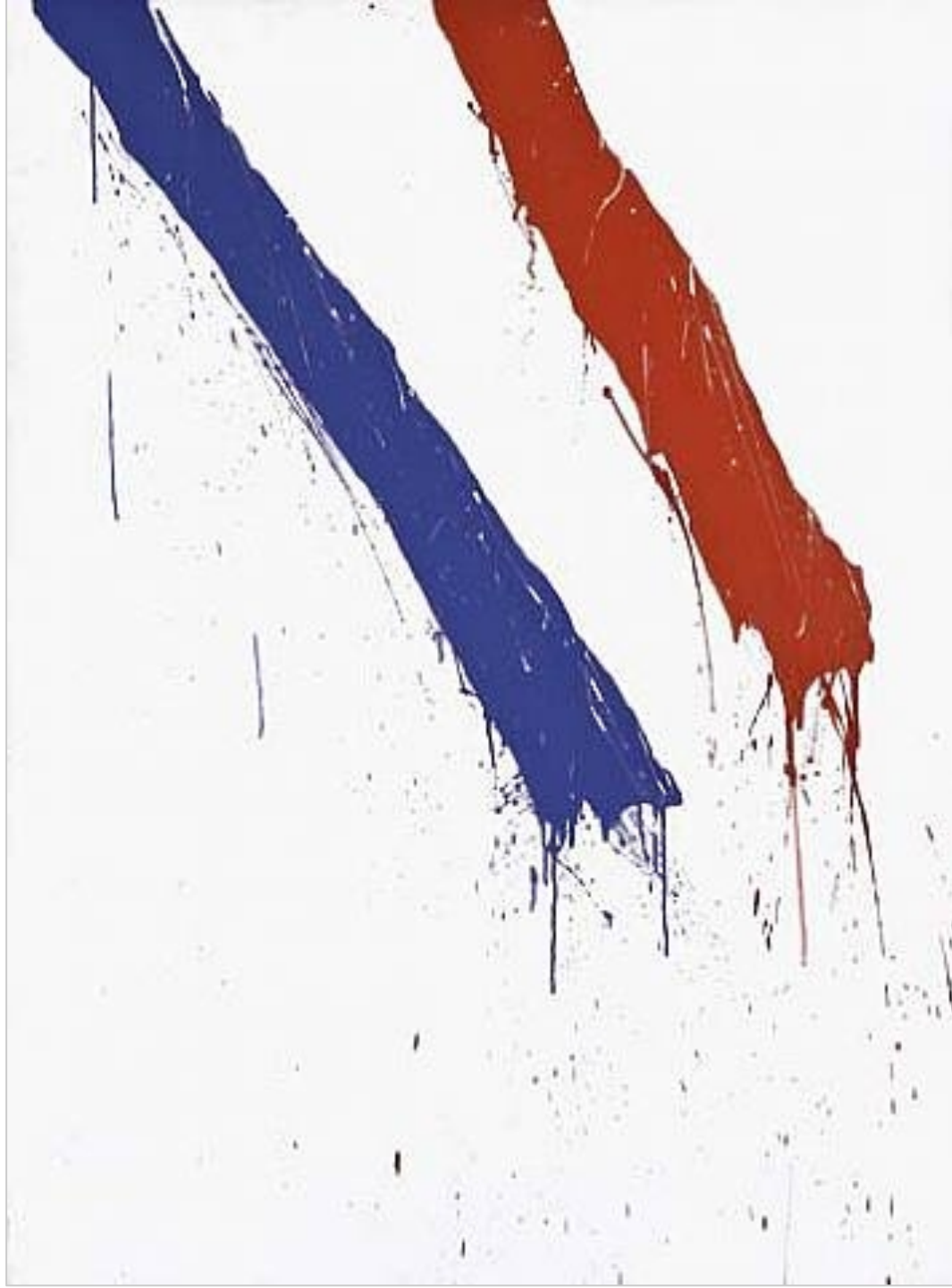
Serge Lemoyne, Sans titre (1976)