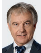
Conrad Engler H+ Die Spitäler der Schweiz, Bern / H+ Les Hôpitaux de Suisse, Berne