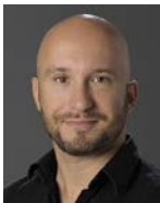
Stefan Althaus H+ Die Spitäler der Schweiz, Bern / H+ Les Hôpitaux de Suisse, Berne