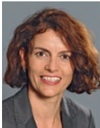
Domenika Schnider Neuweiler Alters- und Pflegeheim Haus Wieden, Buchs