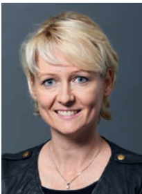
Isabelle Moret Présidente de H+