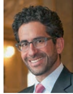
Fathi Derder Conseiller national PLR Les Libéraux-Radicaux, Vaud